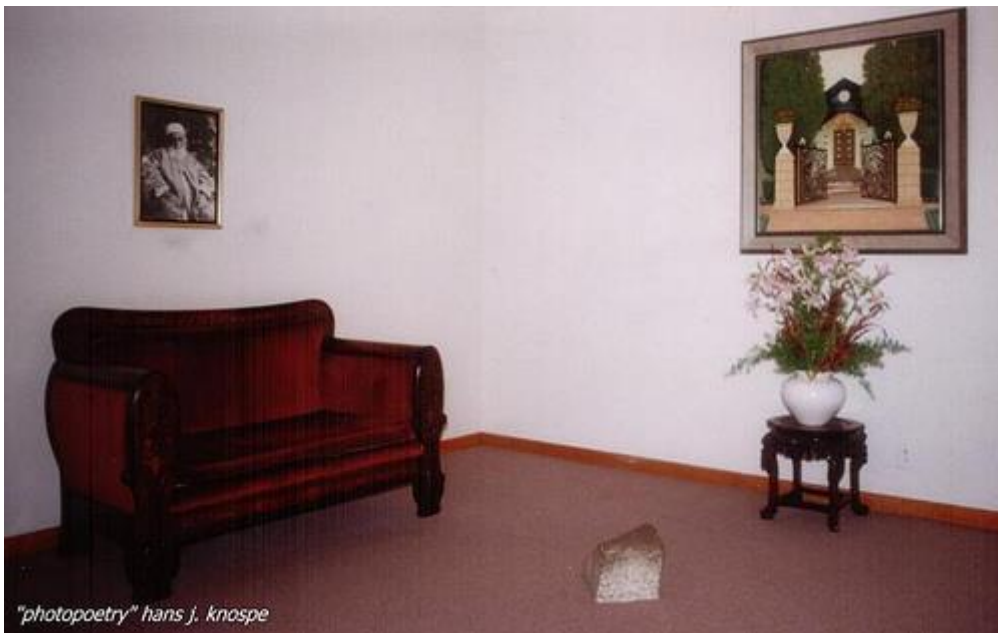
ห้องในสักการะสถานที่เมืองชิคาโก สหรัฐอเมริกา และศิลาฤกษ์

เน็ตตี้และเพื่อนต้องขึ้นรถรางสองต่อกว่าจะมาถึงเมืองวิลเมตท์ซึ่งที่ดินได้ถูกซื้อเพื่อก่อสร้างสักการะสถาน ทั้งสองช่วยกันผลักรถเข็นไปยังจุดที่เตรียมไว้สำหรับวางศิลาฤกษ์แต่รถเข็นเด็กเกิดเสียขณะถูกเข็นไปถึงที่นั่นซึ่งอยู่ไม่ไกลกันนัก เน็ตตี้ไม่ยอมแพ้ เธอขอให้เด็กชายคนหนึ่งซึ่งกำลังเข็นรถเข็นของอยู่ให้ช่วย ทั้งสามช่วยกันย้ายก้อนหินจากรถเข็นเด็กไปใส่ในรถเข็นของและช่วยกันผลักรถจนถึงที่ดินสร้างสักการะสถาน ทั้งสามต้องการขนหินไปยังจุดกึ่งกลางของที่ดินแต่รถเข็นของก็เกิดไปชนกับอะไรบางอย่างทำให้พลิกคว่ำและหินก็ร่วงจากรถสู่ดิน