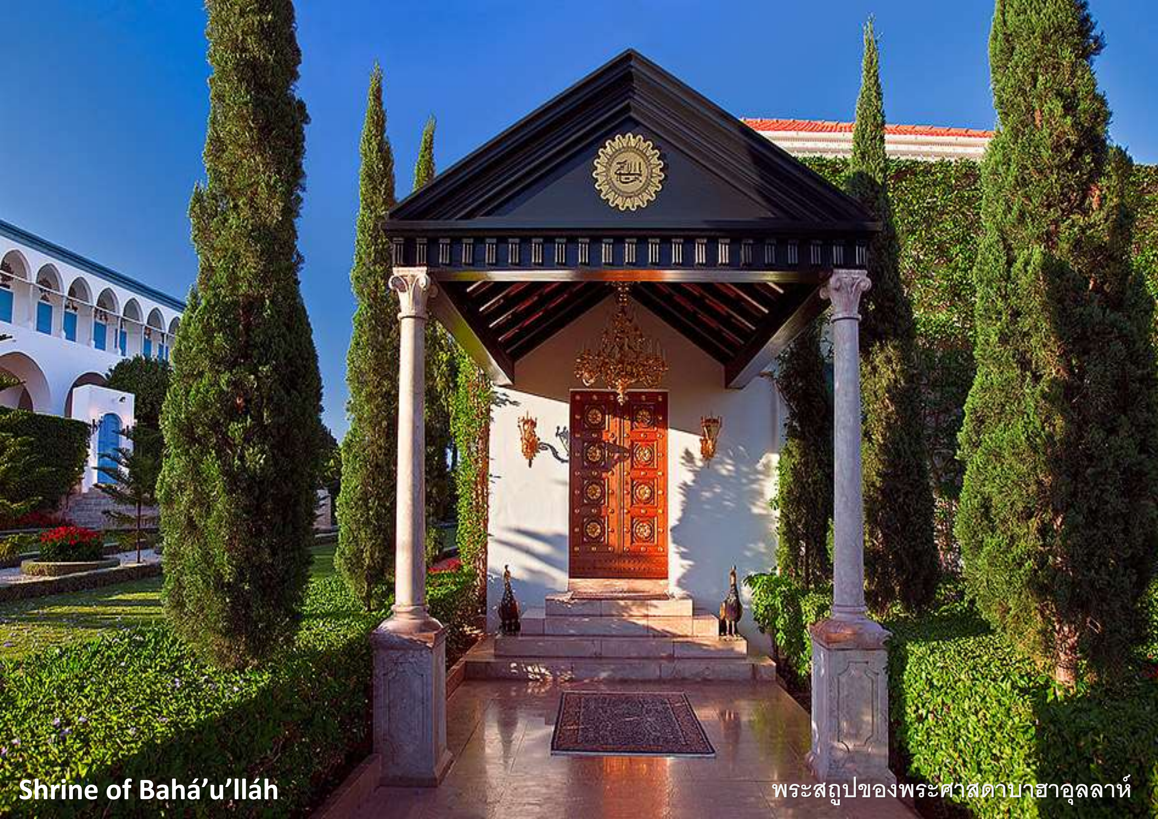
Shrine of Bahá'u'lláh