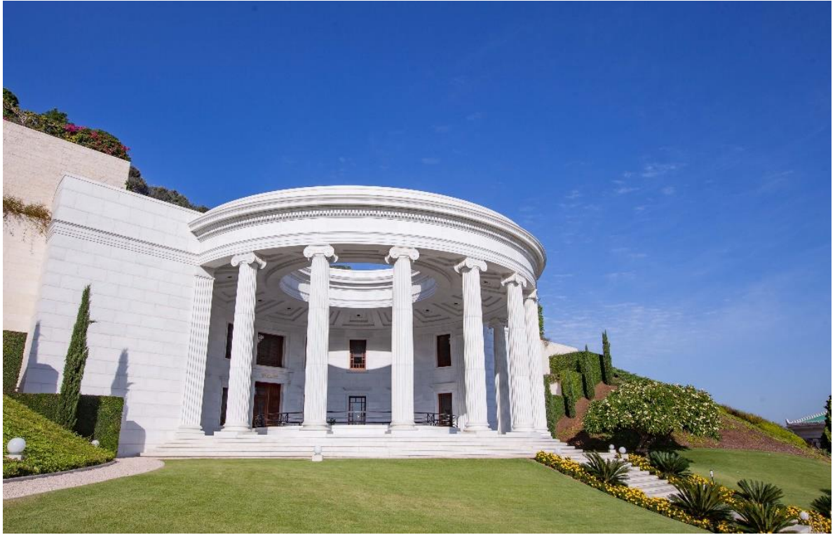
ศูนย์การศึกษาพระธรรม