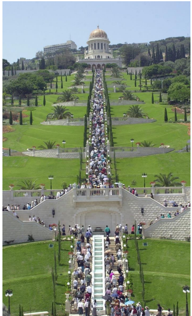
พิธีเปิดระเบียงพระสถูปของพระบ๊อบ เมื่อเดือน พฤษภาคม พ.ศ. 2544 (ค.ศ. 2001)